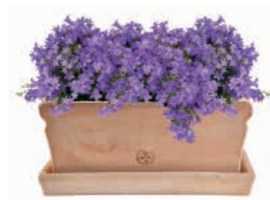
Der Unterteller greift die geschwungene Gefäßform auf. The saucer reveals the traditional curving shape.