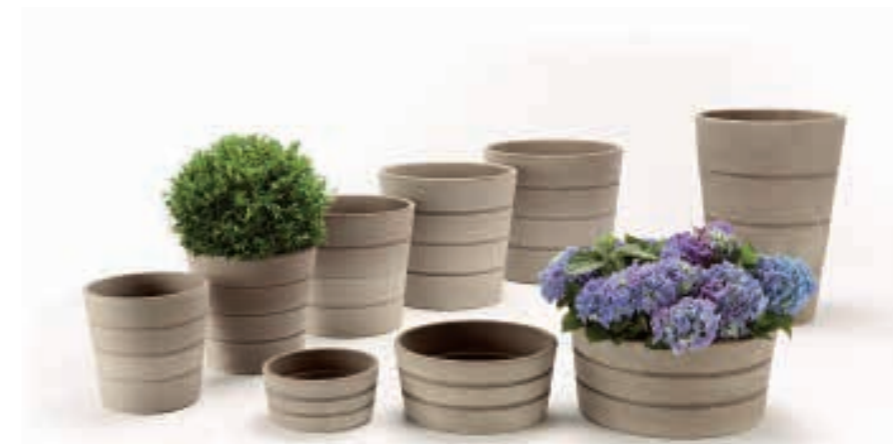
Die gesamte Vielfalt auf einen Blick: Übertöpfe, Schalen und Hochgefäß. The complete product range at a glance: Pots, bowls and high pot.