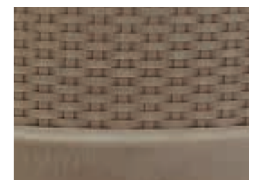
Attraktives Rattan-Relief auf Keramik. Attractive rattan relief.