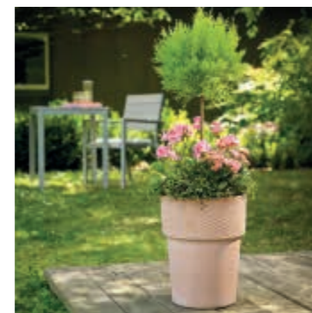
Pflanzbeispiel mit Zypresse und Blühpflanzen. Great for cypress and flowering plants, for example.