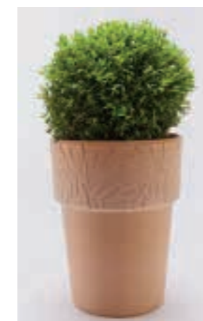
Pflanzbeispiel mit Buchs. Planting example with box tree.