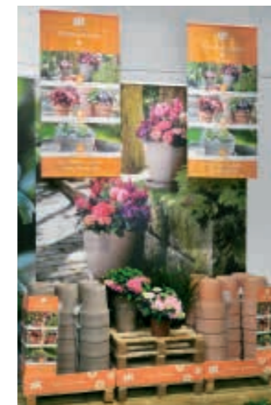
Fahnen als Blickfang für die Zweitplatzierung. Eye-catching flags for the second placement.