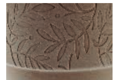
Natürliches Blattranken-Relief auf Keramik. Natural leaf relief on ceramics.