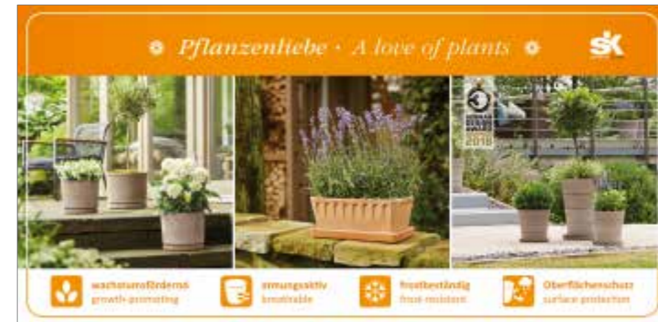
Emotionales Regalbanner. Emotional shelf banner.

Our Service does not end with the dispatch of the goods. We see ourselves as a business partner and offer emotional and sales-driving materials for our Open-Air assortment.