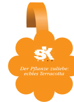
Aufmerksamkeitsstarker Wobbler. Striking wobblers.