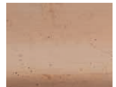
Gefäße aus besonders hochwertiger „Galestro“-Terrakotta. Vessels made of high-quality 'Galestro' terracotta.