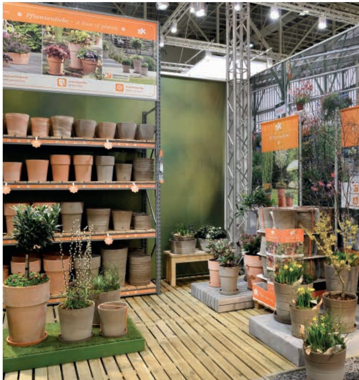
Attraktive Regalpräsentation am Point of Sale. Attractive presentation at the point of sale.