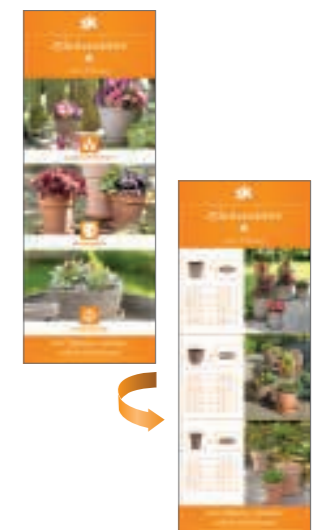
Regalstopper mit Größenzuordnung. Shelf stoppers to scale.