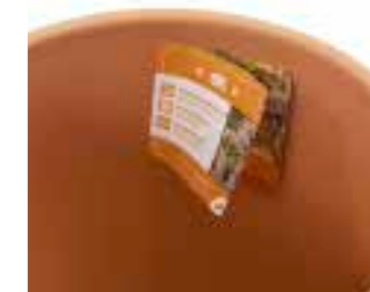
Dekoratives Etikett mit Produktvorteilen. Decorative label with product advantages.