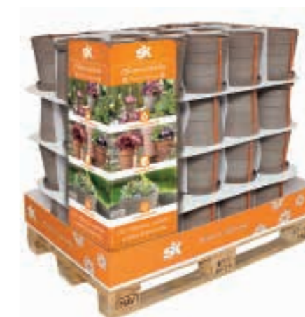
Palette mit Eck-Aufsteller und Banderole. Pallet with corner display and banderole.